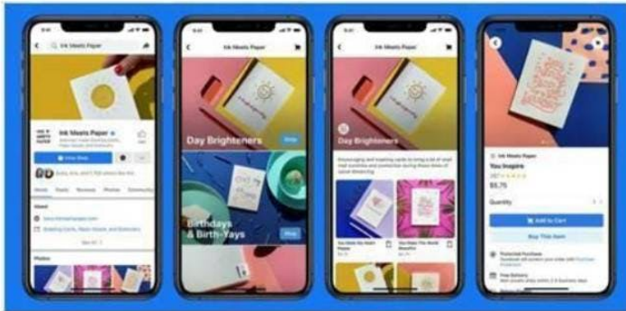
Facebook Shops will allow sellers to create digital storefronts on Facebook or Instagram

„Facebook Shops“ ermöglichen jedem Verkäufer die Werbung über digitale Schaufenster auf Facebook oder Instagram.